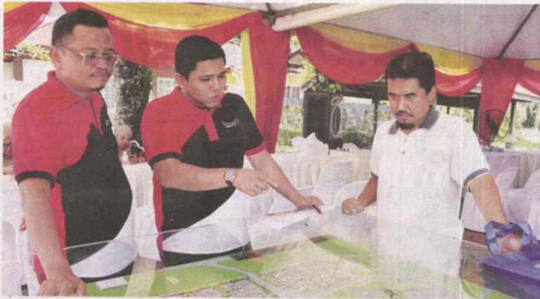
Anggota PKNS memberikan penerangan berkaitan projek Dillenia kepada pengunjung.