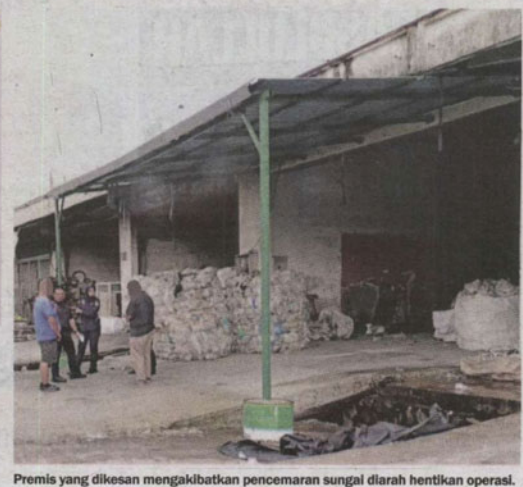
Premis yang dikesan mengakibatkan pencemaran sungai diarah hentikan operasi.