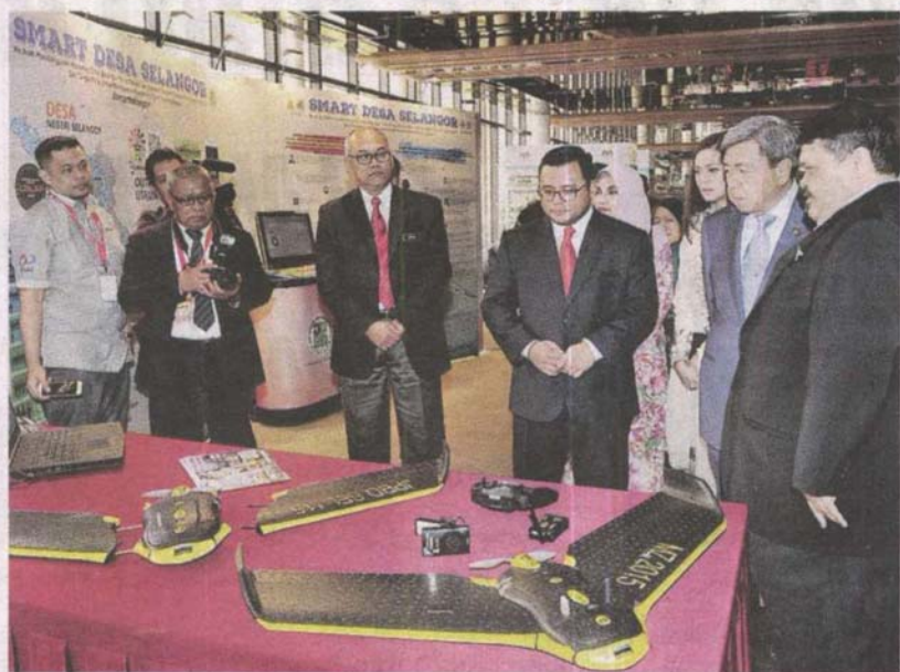
Amirudin (empat, kiri) bersama Sultan Sharafuddin Idris Shah (dua, kanan), Tengku Permaisuri Selangor, Tengku Permaisuri Norashikin (tiga, kanan) melawat ruang pameran.

Sementara itu, Amirudin turut menjelaskan kerajaan telah mengenal pasti tiga lokasi di negeri ini iaitu