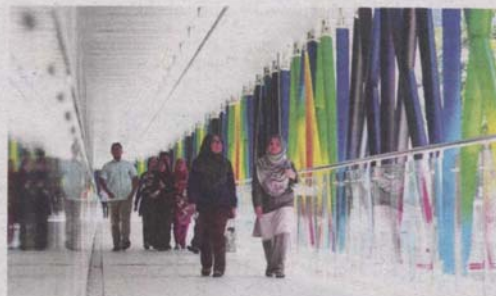
KAJIAN IWB pada tahun lalu mendapati kebanyakan wanita merasa tidak selamat ketika bersiar-siar di Selangor. – Gambar hiasan

"Walaupun perkara itu dianggap kecil namun ia memberikan kesan besar terhadap keselesaan