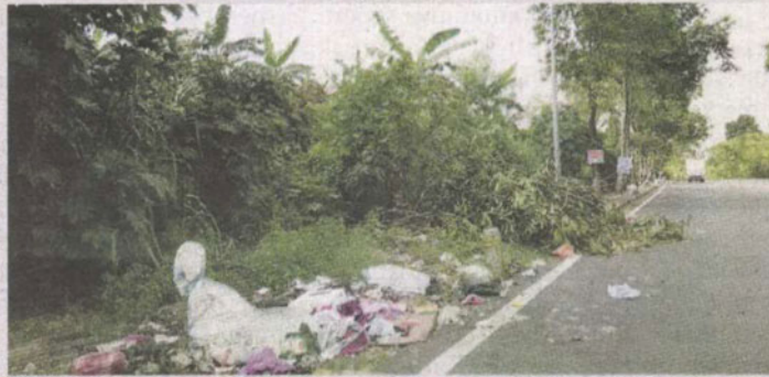
Dahan pokok dan sampah sarap yang dibuang di bahu jalan.