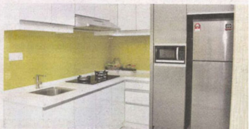
Ruang yang selesa dan rekabentuk menarik menjadi tarikan.