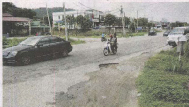
Keadaan jalan yang berlubang dan membahayakan nyawa pengguna jalan raya.