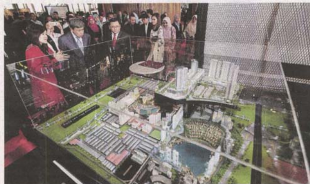
Sultan Sharafuddin (dua, kiri) bersama Tengku Permaisuri Norashikin (empat, kanan) ketika melawat ruang pameran Hari Perancangan Bandar Sedunia Peringkat Negeri Selangor, semalam.

Tengku Permaisuri Selangor Tengku Permaisuri Norashikin turut berangkat