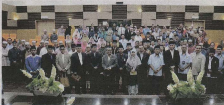
Sebahagian mereka yang menghadiri Majlis Apresiasi Ilmuwan Islam di Ildas.